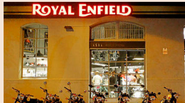
Local de Royal Enfield, en la calle Buenos Aires, número 53.

nados del mundo del motociclismo. Esta apertura entra dentro de su estrategia de crecimiento en España, donde ya cuenta con dos locales más, en Madrid y en Valencia. Durante el año pasado, Royal Enfield aumentó su facturación un 79% y a finales del pasado septiembre, la marca ya había superado las ventas de 2015. Ahora, se plantea abrir en Lisboa y en Palma de Mallorca.